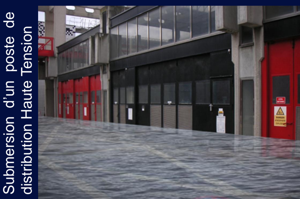
Submersion d'un poste de distribution Haute Tension