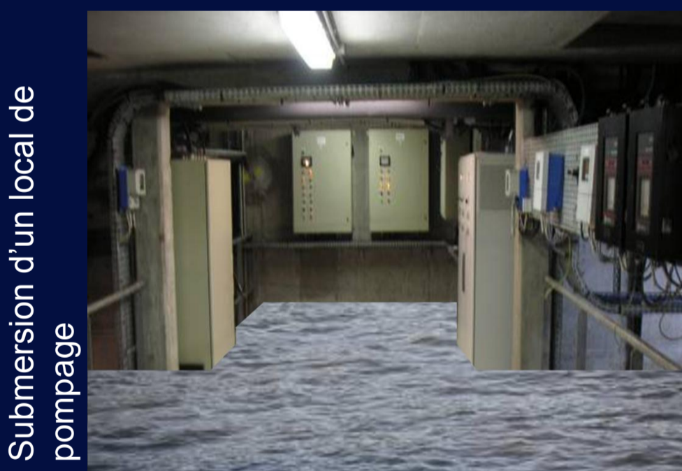
Submersion d'un local de pompage