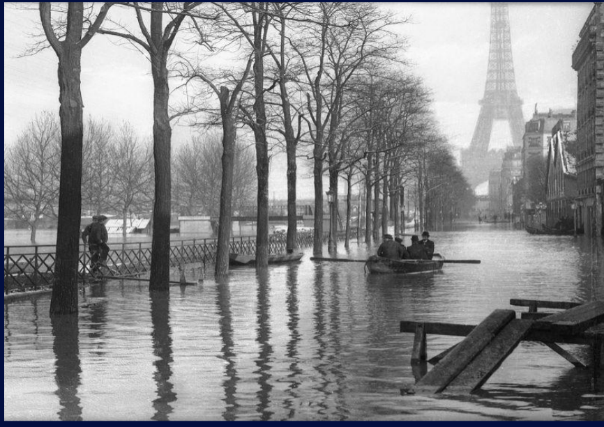
Crue de 1910, quai de Grenelle Paris

Chaque année, une crue centennale a 1 chance sur 100 de se produire.